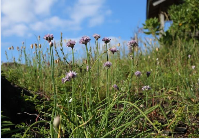
場所：卯敷海岸 撮影日：2021年5月29日

5月下旬ごろになると隠岐の海岸にはネギに似た茎に薄紫色の花をつけた「シロウマアサツキ」が見られます。