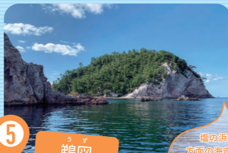
5 うず 鵜図

塩の浜から津戸集落方面の海岸に位置している無人島。滑り台のような変わった形をしている。