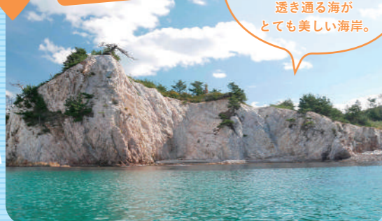
4 おとめこかいがん 乙女子海岸

乙女子海岸は隠岐を代表するアルカリ流紋岩から出来ており、白い崖と透き通る海がとて美しい海岸。